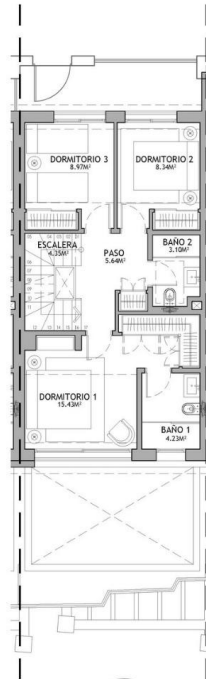
PLANTA ALTA T3 V06