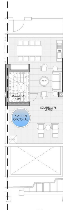
PLANTA SOLÁRIUM T3 V06