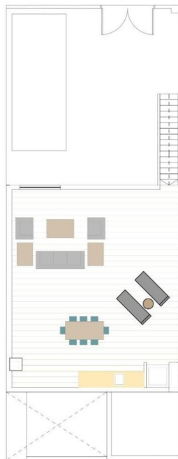
PLANTA DE CUBIERTA