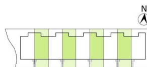
CUADRO DE SUPERFICIES