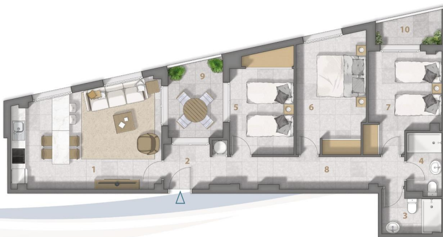
Planta primera Vivienda G